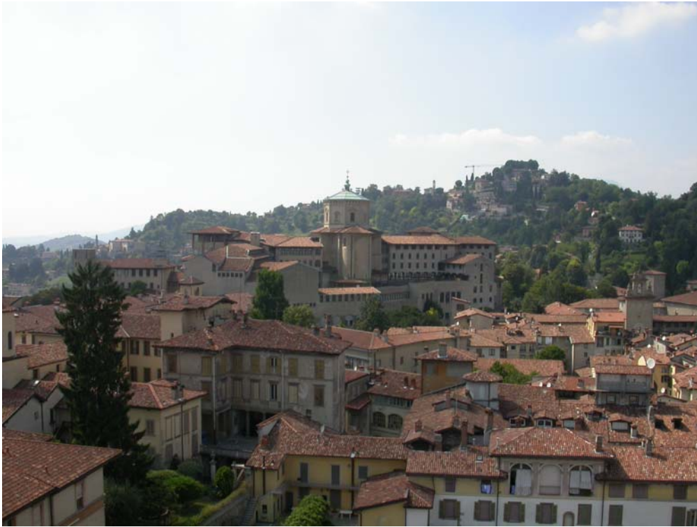
Toits de Bergame, côté séminaire et coté montagne.

Il se trouve parfois des tuiles anciennes d'occasion. Elles sont à respecter en fonction non seulement de leur grande beauté, avec ces variantes de couleur, mais aussi par leur ancienneté, certaines ayant facilement plus d'un siècle.