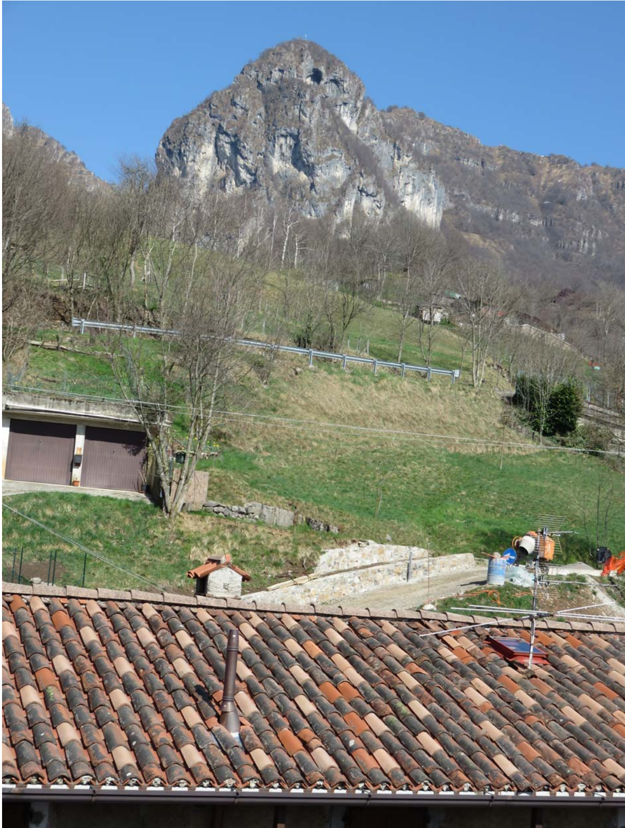
Sur certains toits l'on a supprimé les pierres. Les tuiles du bas sont tout simplement cimentées.